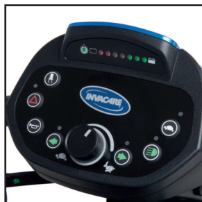
Tableau de bord LCD intuitif Pegasus METRO

Conçu pour être utilisé facilement et avec précision, doté de boutons surélevés, de lumières DEL, de signaux sonores et d'un indicateur de batterie lumineux affichant le pourcentage de batterie restante.