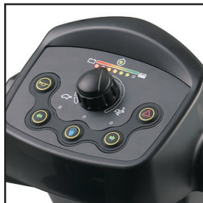
Tableau de bord « intuitif »

Les lumières des freins arrière s'allument au relâchement de l'accélérateur. Les indicateurs de direction gauche et droit arrêtent automatiquement de clignoter après 30 secondes.