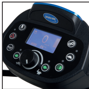
Tableau de bord LCD Pegasus PRO , Comet PRO , Comet ULTRA

Conçu pour être utilisé facilement et avec précision, doté de boutons surélevés, de lumières DEL, de signaux sonores et d'un indicateur de batterie lumineux affichant le pourcentage de batterie restante.