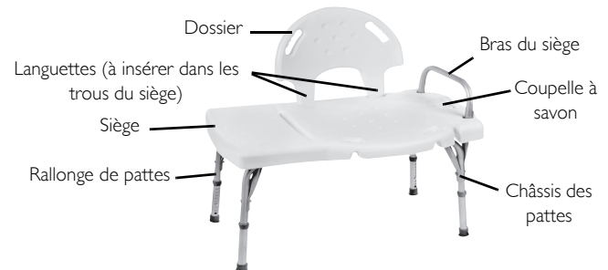
SCHÉMA "B" - AUTRES MODÈLES DE BANCS DE TRANSFERT MODEL 9871